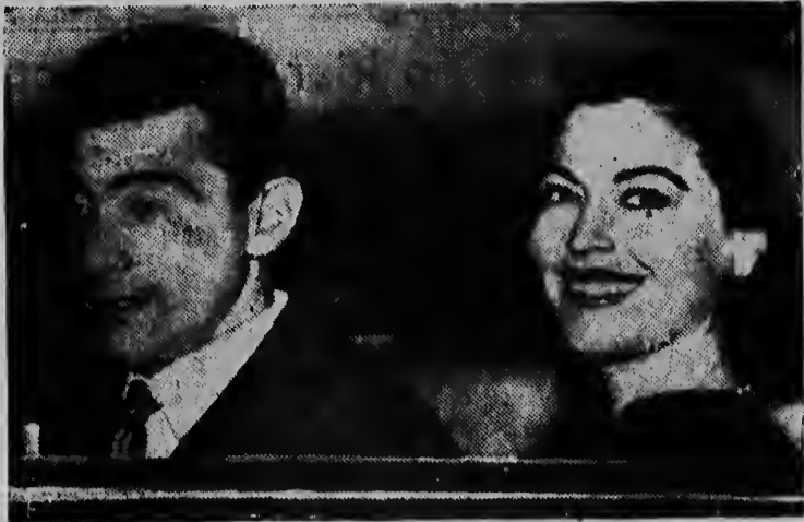
Milan, Italia, a bini noticia di casamiento di e artista di comedia Walter Chiari cu e actriz di film Ava Gardner. Aki nan ta keiru den auto hunto na Milan. Ava a divorcia di Frank Sinatra.